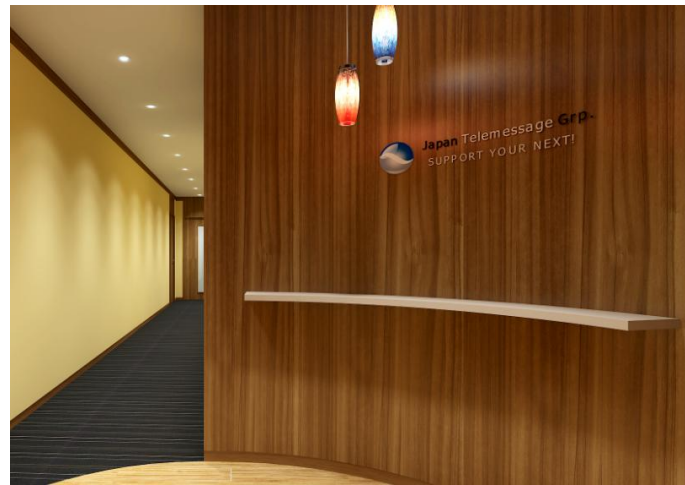
新オフィス エントランスイメージ